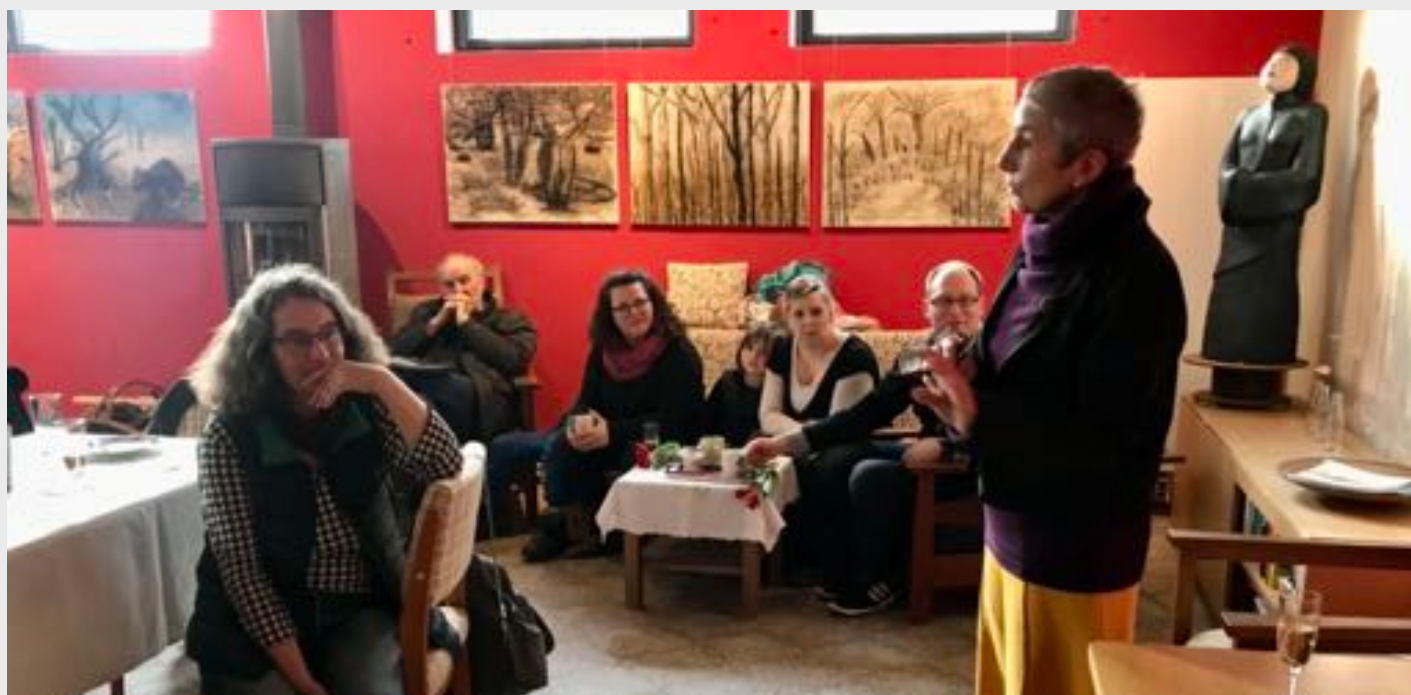
Vernissage Ausstellung „Alter Konsum“ 09.03.2019