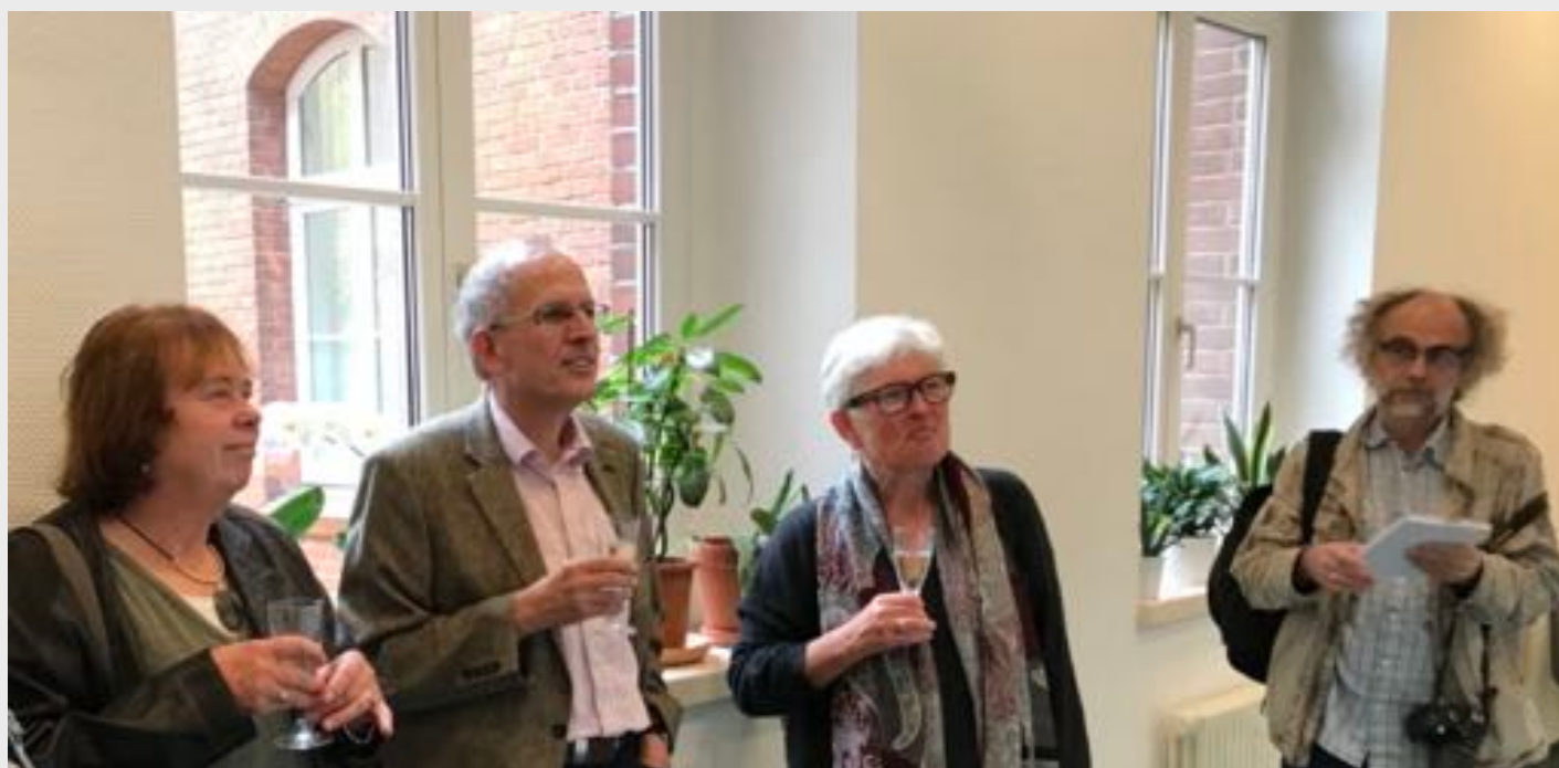
Midissage Kreisverwaltung Neuruppin 25.09.2019