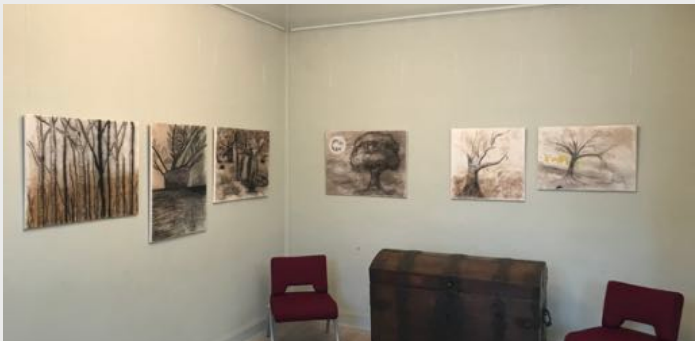
Ausstellung Wegemuseum Wusterhausen | 1.06 - 09.08.2020