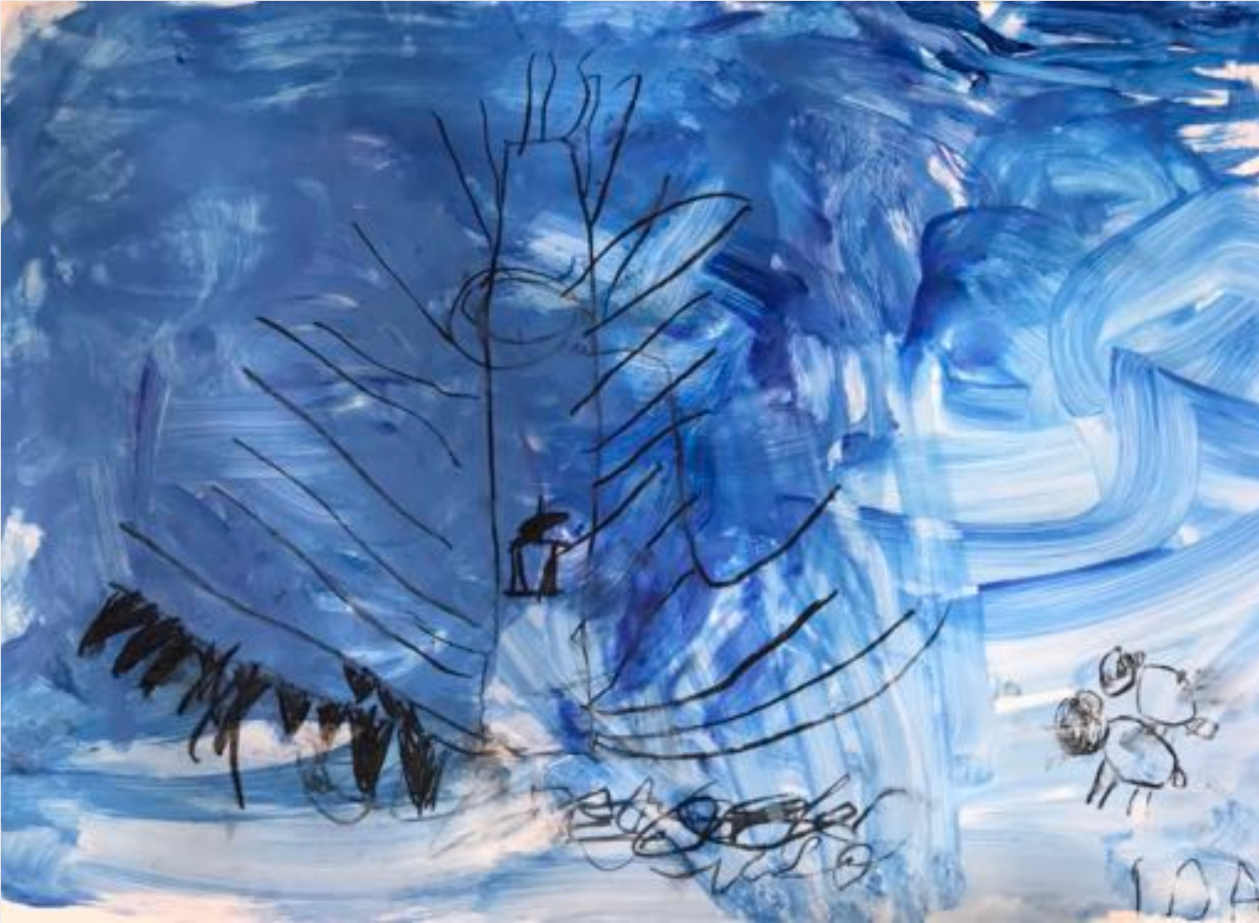
Ida Rüsche (4)