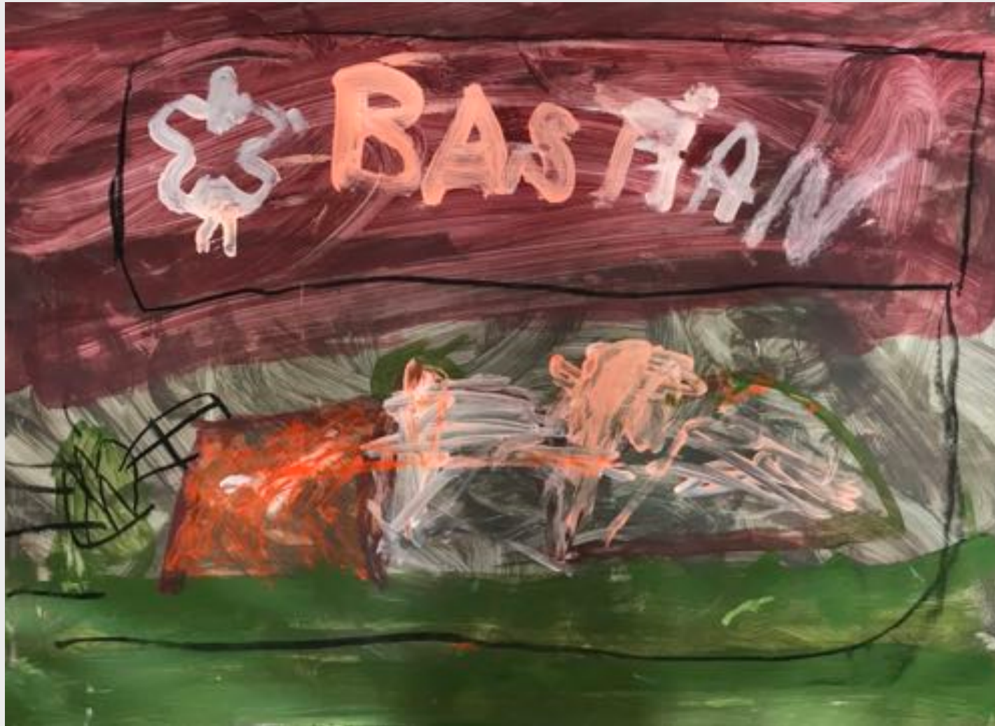
Bastian Klitzke (6)