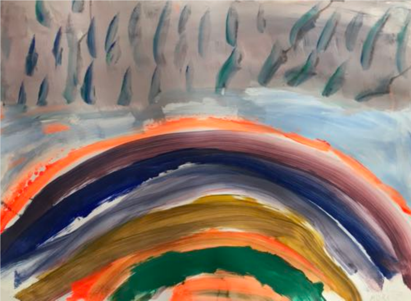
Moritz Jaedicke (7)