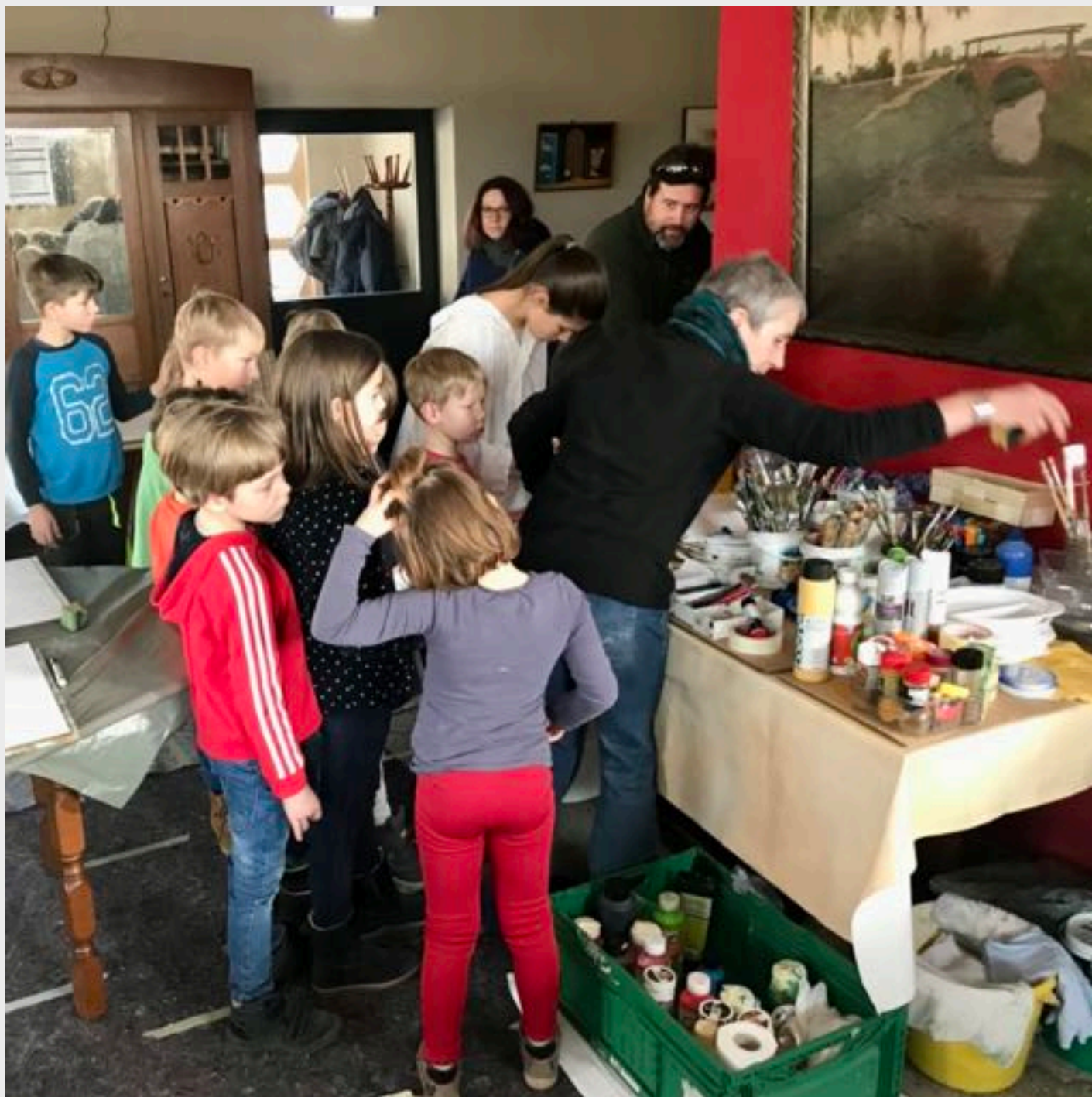
Workshop für Kinder 17.02.2019 im „Alten Konsum“