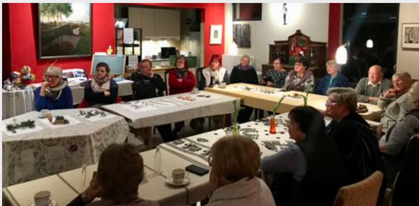
Vorbesprechung 29.01.2019 im „Alten Konsum“