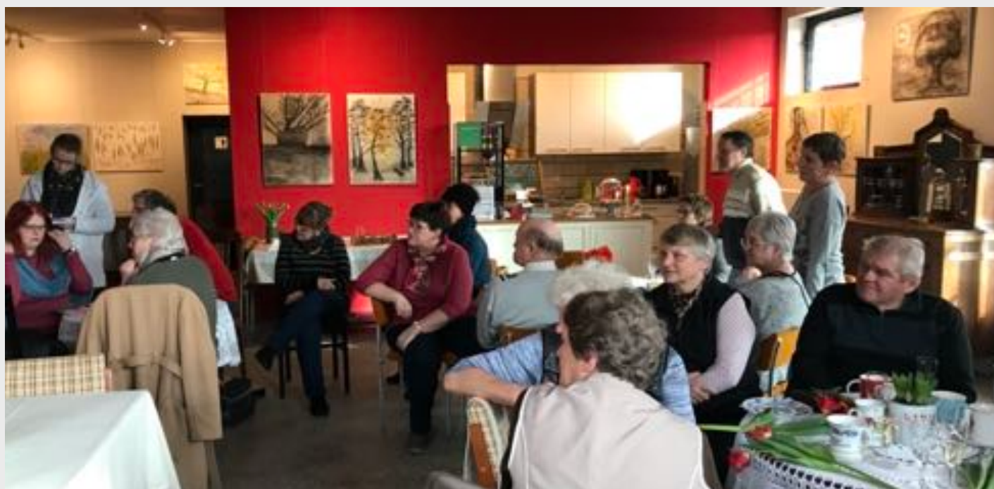
Vernissage Ausstellung „Alter Konsum“ 09.03.2019