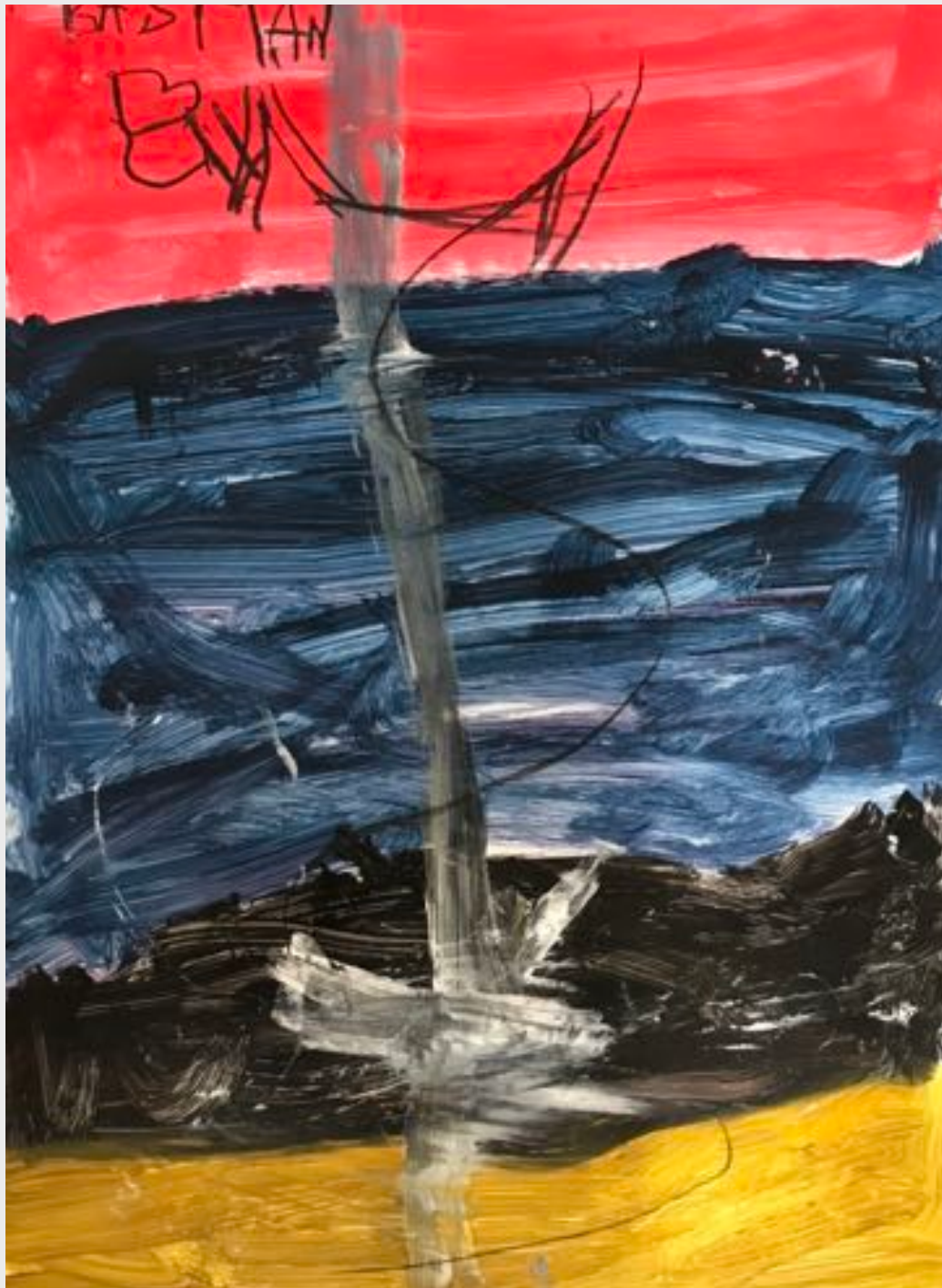
Bastian Klitzke (6)