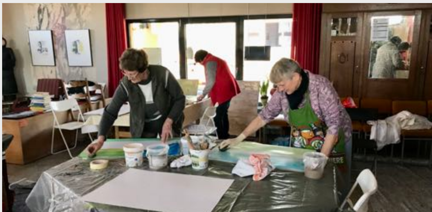
Workshops 15. und 16.02.2019 im „Alten Konsum“