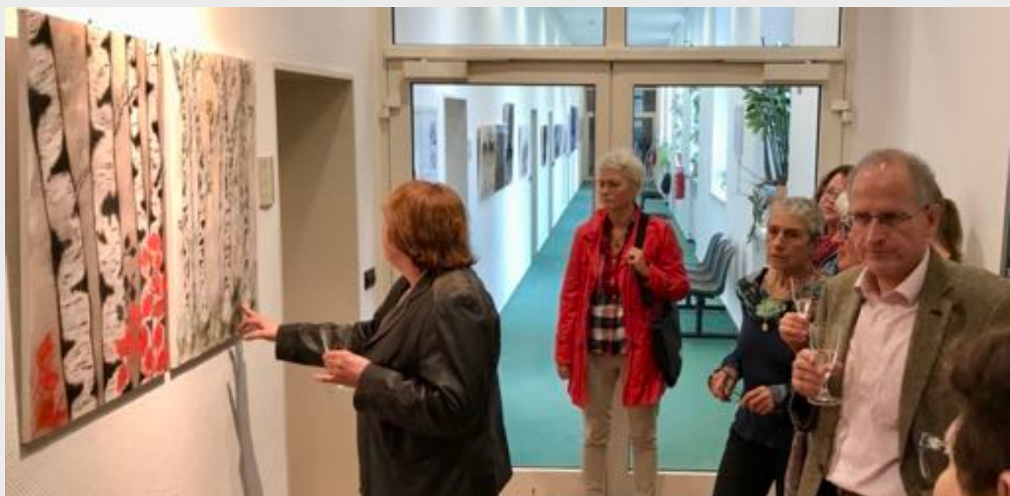
Midissage Kreisverwaltung Neuruppin 25.09.2019