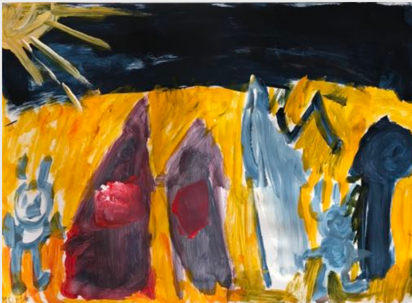
Moritz Jaedicke (7)