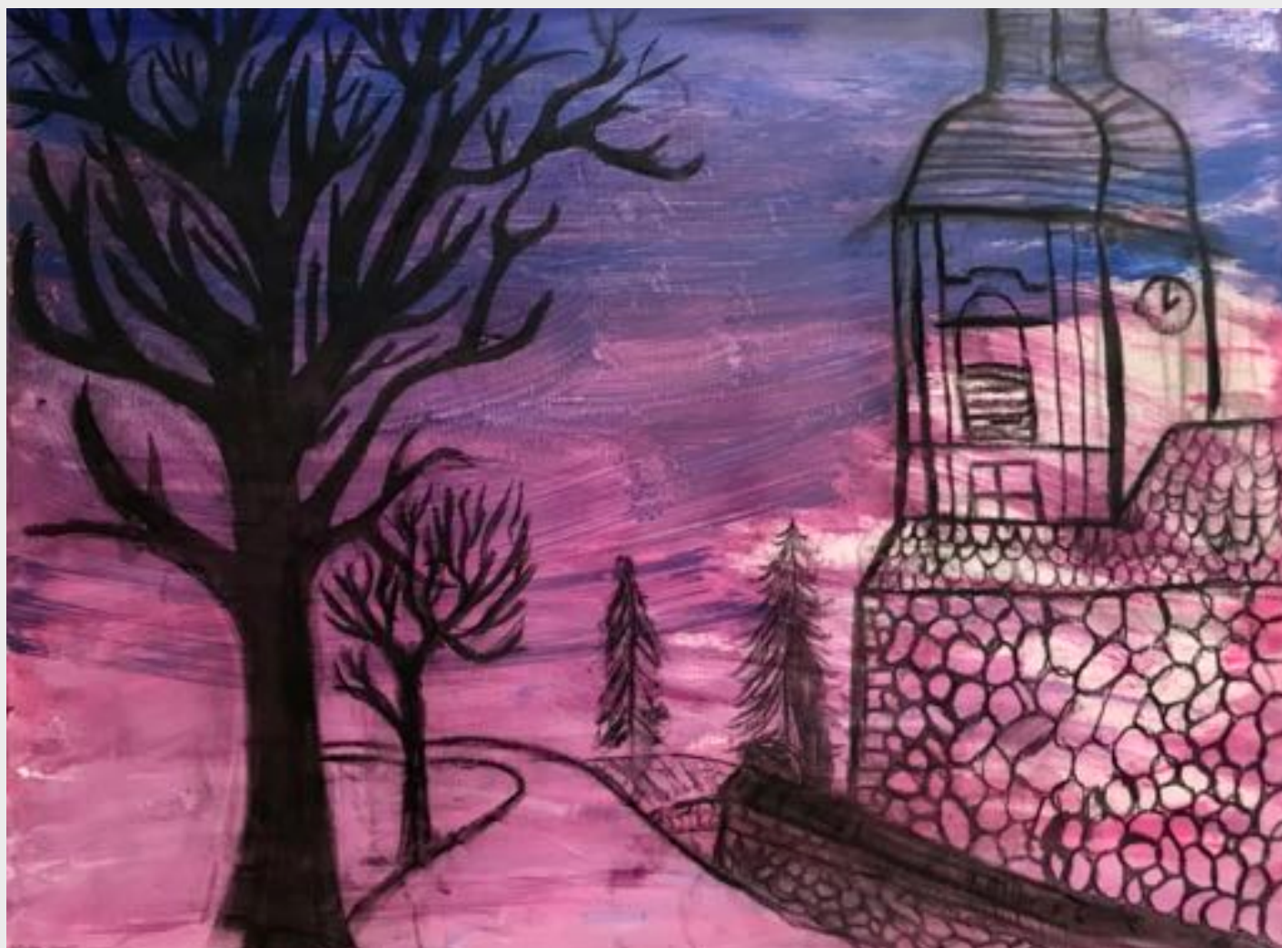
Wiebke Schröder (12)